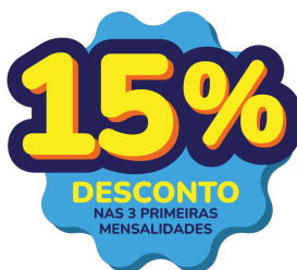
TABELA SEM DESCONTO. APLICAR CONDIÇÃO SOMENTE ATÉ AS VIGÊNCIAS DE SET/26.

INCLUSO HAPVIDA INTERODONTO PROTEÇÃO ODONTOLÓGICA CA - 495.624/23-9